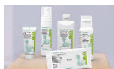
Bereitstellen der benötigten Produkte