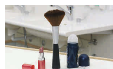
Nicht erlaubte Pflegeutensilien