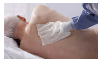
Rücken vom Hals bis zum Gesäßbereich waschen