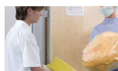
Wäsche in einem flüssigkeitsdichten Wäschesack sammeln