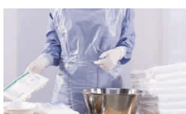
Bereitstellen der nötigen Pflegeutensilien