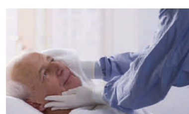
Augen schließen, Gesicht waschen