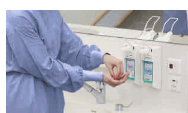
Immer nach Ausziehen der Schutzhandschuhe korrekte Händedesinfektion durchführen