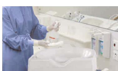
Desinfektion aller benutzten Gegenstände