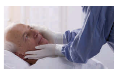
Die komplette Hautoberfläche inkl. Haaren mit separaten Waschlappen reinigen