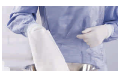
Waschlappen nur einmal eintauchen. Niemals einen benutzten Waschlappen noch einmal eintauchen