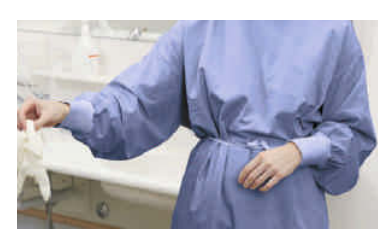
Abfall entsorgen, Schutzhandschuhe ausziehen