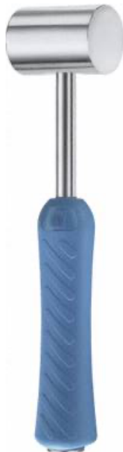
AESCULAP® Hammer mit Silikongriff