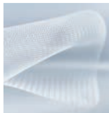
Optilene® Silver Mesh LP*

FÜR DIE OFFENE UND LAPAROSKOPISCHE LEISTEN- UND NARBENHERNIENVER- SORGUNG