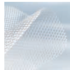
Optilene® Silver Mesh Elastic*