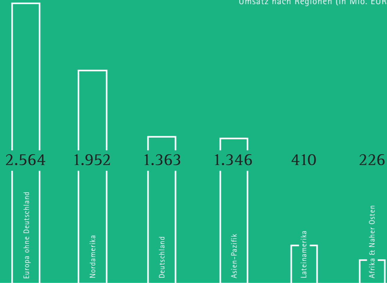
Umsatz nach Regionen (in Mio. EUR)