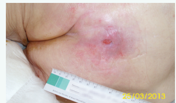
Abbildung 3 Verringerung der Wundgröße und der Exsudatmenge mit Zeichen der Wundheilung in der 16. Woche