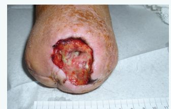
Abbildung 1 Wundstatus bei Vorstellung

Bei Amputierten kommt es häufig zur Entwicklung von Druckgeschwüren am Stumpf und es ist wichtig, die anfällige Haut zu schützen, um weitere Komplikationen und chirurgische Eingriffe zu vermeiden. Askina DresSil® wurde gut vertragen und bietet ein hohes Maß an Komfort. Die Gesamtleistung des Verbandes in Bezug auf seine Haftfähigkeit und seine einfache Anwendung wurde als ausgezeichnet beurteilt. Nach Heilung seiner Wunde wurde der Patient aufgefordert, seine Prothese zu tragen, um seine Mobilität zu verbessern.