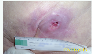
Abbildung 2 Erscheinungsbild der Wunde in Woche 3