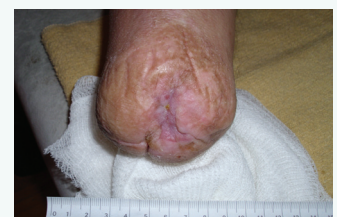
Abbildung 2 Erscheinungsbild des Stumpfs in Woche 8