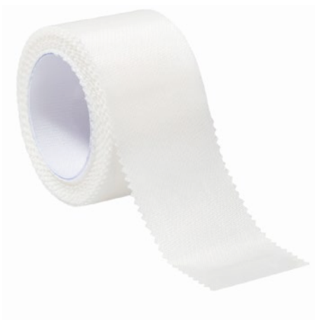
Askina® Silk Seidenpflaster zur Fixierung

Abrechnungsfähig als Sprechstundenbedarf. Bitte beachten Sie die individuellen Regelungen in den Sprechstundenbedarfsvereinbarungen der jeweiligen KV-Bezirke