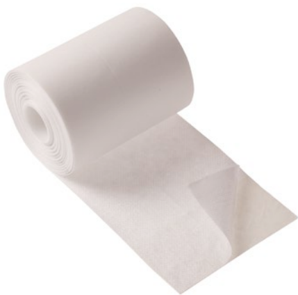
Askina® Fix Selbstklebendes, weißes Fixiervlies auf der Rolle zum individuellen Zuschneiden

Abrechnungsfähig als Sprechstundenbedarf. Bitte beachten Sie die individuellen Regelungen in den Sprechstundenbedarfsvereinbarungen der jeweiligen KV-Bezirke