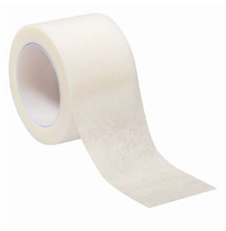
Askina® Pore Vliespflaster zur Fixierung

Abrechnungsfähig als Sprechstundenbedarf. Bitte beachten Sie die individuellen Regelungen in den Sprechstundenbedarfsvereinbarungen der jeweiligen KV-Bezirke