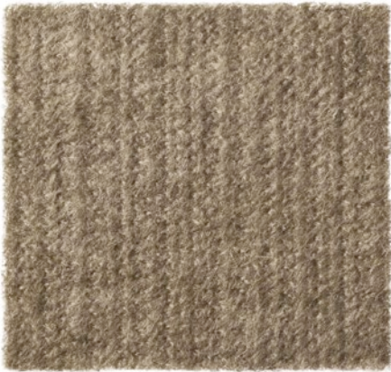
Askina® Calgitrol® Ag+ Silberhaltige Wundauflage

Als Verbandmittel (patientenindividuell) verordnungs- und erstattungsfähig