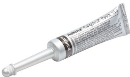
Askina® Calgitrol® Paste Silber-Alginat aus der Tube

Als Verbandmittel (patientenindividuell) verordnungs- und erstattungsfähig