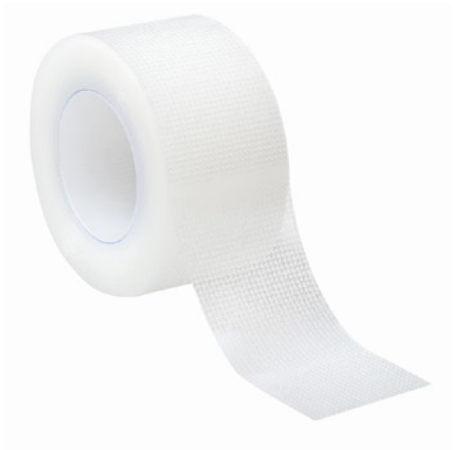
Askina® Film Folienpflaster zur Fixierung

Abrechnungsfähig als Sprechstundenbedarf. Bitte beachten Sie die individuellen Regelungen in den Sprechstundenbedarfsvereinbarungen der jeweiligen KV-Bezirke