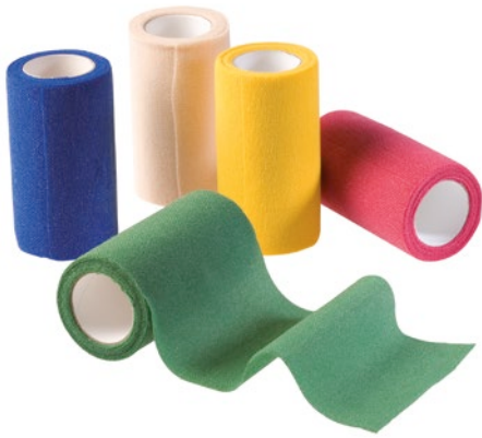
Askina® Haft Color Sortimentsbox Farbige kohäsive Fixierbinde

Abrechnungsfähig als Sprechstundenbedarf. Bitte beachten Sie die individuellen Regelungen in den Sprechstundenbedarfsvereinbarungen der jeweiligen KV-Bezirke