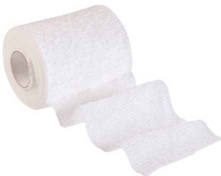
Askina® kohäsive Fixierbinde Selbsthaftende elastische Fixierbinde

Abrechnungsfähig als Sprechstundenbedarf. Bitte beachten Sie die individuellen Regelungen in den Sprechstundenbedarfsvereinbarungen der jeweiligen KV-Bezirke